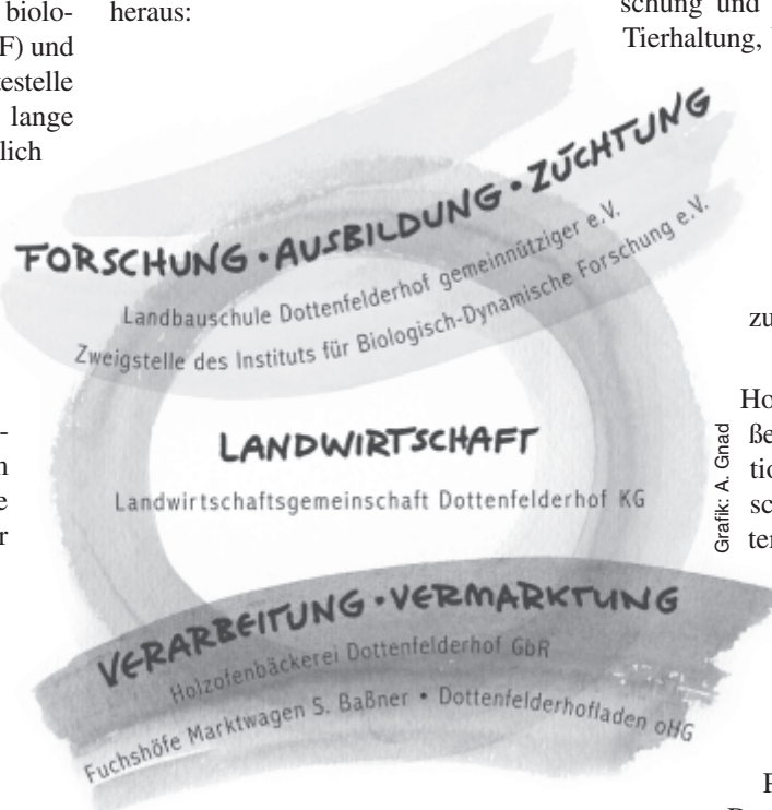
Abb. 1: Das Modell Dottenfelderhof: Nach dem Willen der Bewirtschafter Bild einer zukünftigen Agrarkultur

Diese „interdisziplinäre Hofforschung“ wird nach außen durch vielfältige Kooperationen mit anderen Forschungsinstitutionen erweitert. Dazu gehören das IBDF, Darmstadt, das Hessische Dienstleistungszentrum für Landwirtschaft, Gartenbau und Naturschutz, Kassel, das Institut für Biologischen Pflanzenschutz der BBA, Darmstadt sowie die Fachberei-