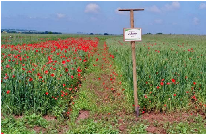
'Jularo' (rechts im Bild) mit starker Unkrautunterdrückung gegenüber Mohn im Vergleich zu Verrechnungsorte (links)

Mit den 'Bildschaffenden Methoden' Kupferchloridkristallisation nach Pfeiffer, Steigbildmethode nach Wala und Rundfilterchromatographie nach Pfeiffer werden von Nahrungsmitteln in Kombination mit verschiedenen Metallsalzen charakteristische Strukturen ausgebildet. Eine Interpretation der Bildstrukturen mit Charakterisierung der Lebensmittelqualität ist anhand von Vergleichsbildern von physiologischen Prozessen wie Reifung und Alterung möglich. Für die Bewertung von Getreide sind zwei Eigenschaften von Bedeutung. Zum einen die Fähigkeit der Alterungsbeständigkeit, zum anderen die Fähigkeit, Stoffe für die menschliche Ernährung zur Verfügung zu stellen.