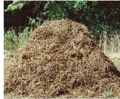
Abb. 3: Optimale Mietenform (Querschnitt; Länge der Miete ist beliebig) mit Strohabdeckung.