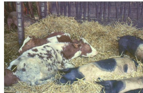
Abb. 1: Die Aufbereitung des Mistes beginnt eigentlich schon im Stall, bei den Tieren, bei Fütterung und Stallsystem.